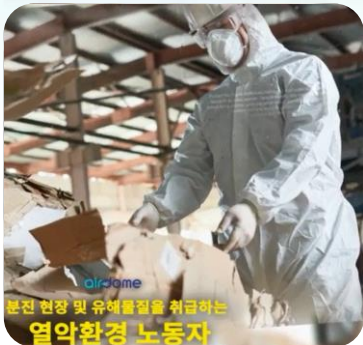
분진 현장 및 유해물질을 취급하는

공공기관 노동자들 근무환경 개선 유형직업 노동자들 근무환경 개선 지역 환경 미화원