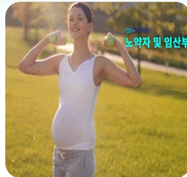
노약자 및 임산부