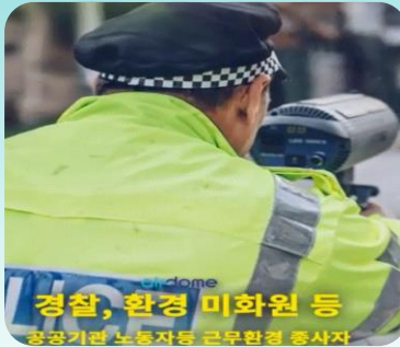
경찰, 환경 미화원 등

공공기관 노동자들 근무환경 개선 유형직업 노동자들 근무환경 개선 지역 환경 미화원