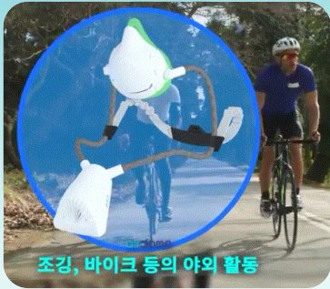
조깅, 바이크 등의 야외 활동